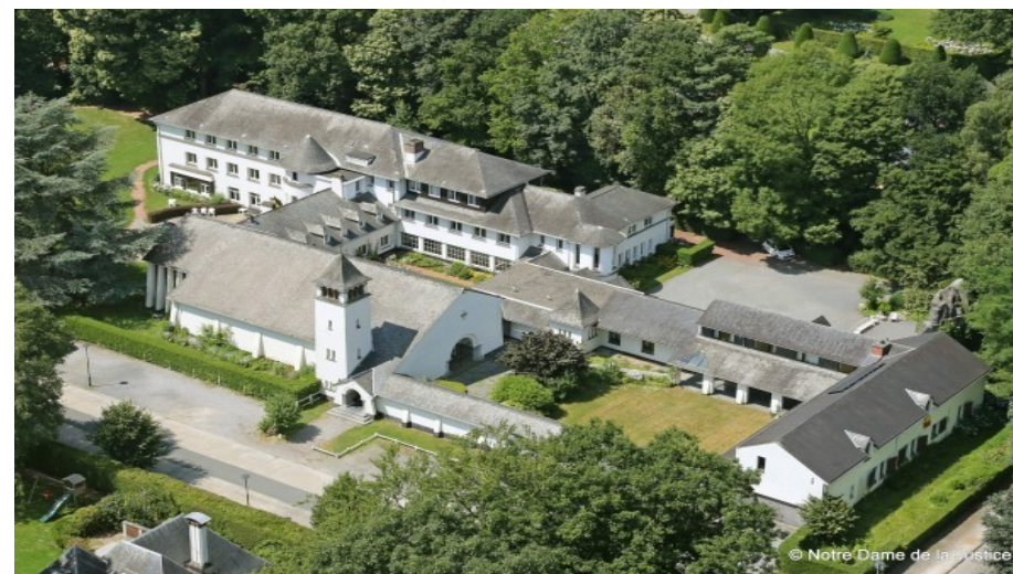
Notre Dame de la Justice Rhode-St-Genèse

Du vendredi 13 au dimanche 15 octobre 2017